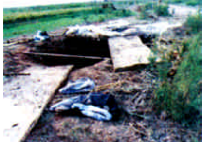
盗油管线远远伸向油井。

滨南公安分处、厂保卫科随后对现场进行了勘察录像，挖出了塑料管线，收回3吨原油，填平埋实油坑。等待不法分子的将是法律的严惩。（王克勇 陈健明）