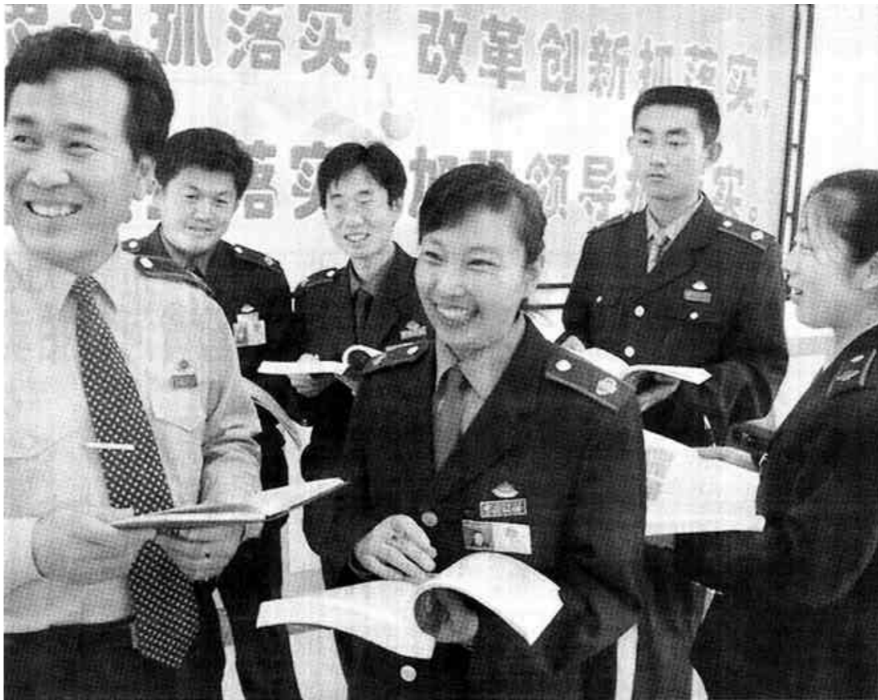
垦利县地税局抓政治业务学习不放松,经常性的组织广大职工进行政治业务知识教育培训,使全体干部的整体素质不断提高。