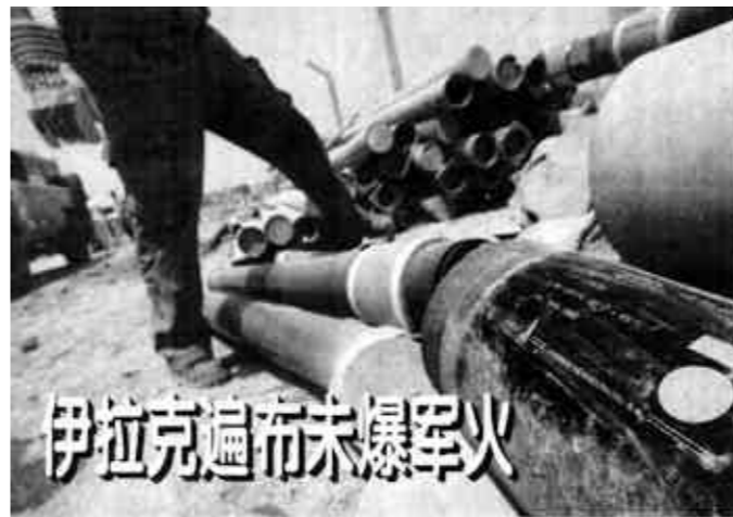
伊拉克遍布未爆军火

6月15日，在伊拉克首都巴格达，一名工作人员查看被废弃的一堆地对空导弹弹头。据透露，目前伊拉克全国不少居民区里散布有大量未爆炸的军火，其中包括集束炸弹和防空导弹。要排除这些爆炸物可能需要数年时间。