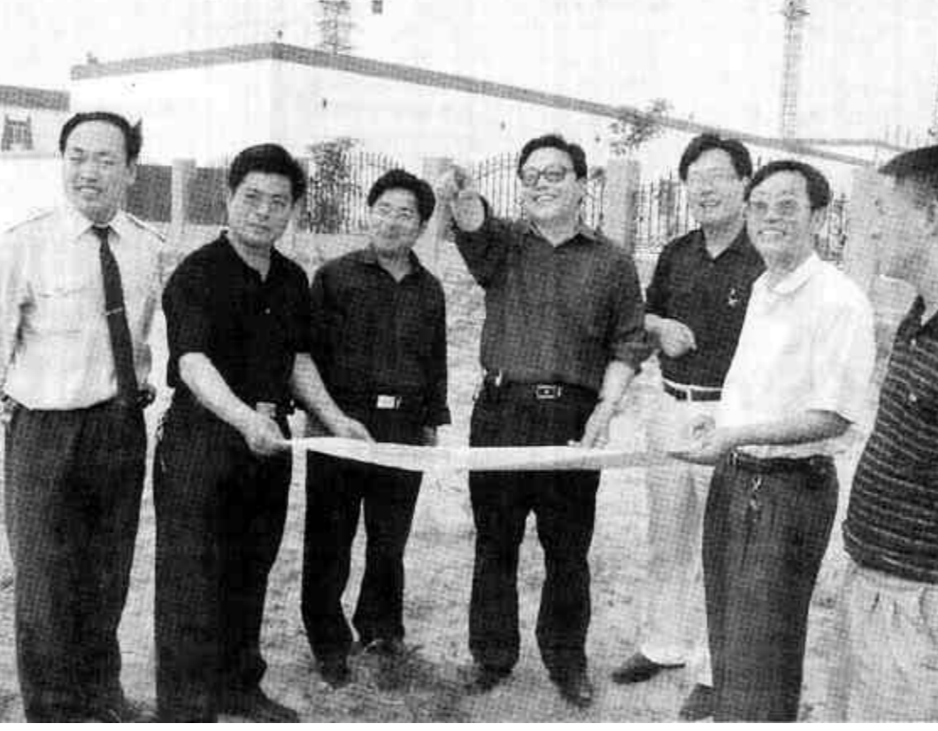
东营市西郊郝家镇工业园规划占地6平方公里,现已引进大型工业项目23个,固定资产投资2.45亿元。图为镇工业园区工作人员对规划进行适应性研究调整。

在前不久结束的市五届人大常委会第2次会议上,无论是常委会组成人员还是列席会议的同志都感到了与以往会议的不同,因为在这次会议上出现了不少新鲜事,也正是这些新鲜事让人们感受到了新一届东营市人大常委会呈现出的新风貌、新气象。虽然会议只有短短的两天,但在第二天上午会议开始的时候,每位与会者手中都拿到了前一天下午分组讨论的会议简报,上面记录着讨论议题时每位同志的发言情况。这又是一件令人感到意外的新鲜事。为了让两个组的与会者能够更好地把握议题的审议情况,及时充分地反映讨论所反映出的一些问题,市人大常委会决定从本次会议开始,由工作人员将分组讨论情况根据记录进行整理,编成会议简报,迅速下发,这次会议的两次分组讨论共形成了4期简报。委员们表示:现在有了会议简报,显得格外庄重整齐。因为每个人的编号是固定的,所以工作人员在会前分发的时候就能很快统计出会议的出席情况,极大地提高了工作效率。我们一定多发言,发好言,把意见建议提到点子上。电脑派上大用场。在参加分组讨论时,会议室里摆放着一台投影仪和笔记本电脑,引起了与会者的好奇,正当与会者纳闷时,投影屏上出现了一张张彩色的城市规划图。原来,在本次会议上,有一项议题是听取市政府关于东西城对接区规划情况的汇报,市规划局为了更形象、更生动地向大家介绍新区规划情况,会议召开前,就向常委会领导请示是否可以用这种新形式向常委会汇报。常委会领导当场表示:这种新形式、新做法非常好,是与与时俱进的具体体现。以后像这样创新工作思路,运用现代化高科技手段,把汇报搞得更生动形象的做法应大力提倡。(徐纯亮 薄涛 刘金虎)