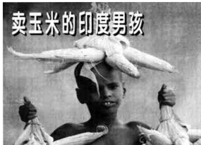
卖玉米的印度男孩

6月17日，一名6岁的印度男孩在加尔各答街头卖玉米。他每天能挣约50卢比（合1美元），以补家用。